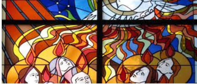
Hoy es Domingo de Pentecostés, 2018